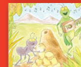
Tšhošane le tšie