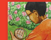
Le ke leino la mang?