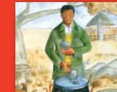
Sopo ya maswika