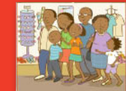
Dineo o ya go reka