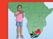
Afrika Borwa ya rena