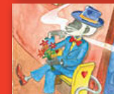
Aa, Morena Kgaboi!