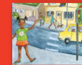
O amogetšwe toropong ya gešu