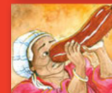
Ditumo tše tharo