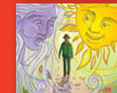
Ngangišano ya moya le letšatši