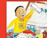
Re loketše go tšea leeto