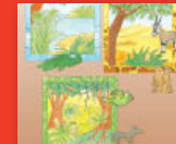
Ke mang yo a dulago mo?