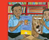
Tau le legotlo