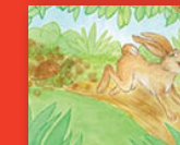
Mmutla le khudu