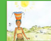
Lufuno u ngafhi?