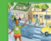
Ḍorobo ya hashu