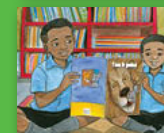
Nda u na mbevha