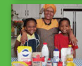
Ri baga na makhulu