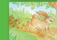
Muvhuḍa na tshibode