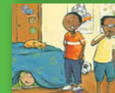
Ri tamba mudzumbamo