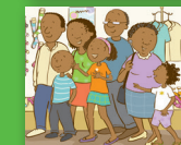
Muṭa u renga zwiambaro