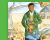
Swobo ya matombo