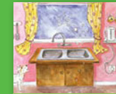
Fasiṭere ḷo kwashea