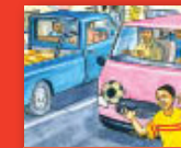
Hu ḁo tevhela mini?