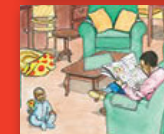
Baba muleli wa ṱwana