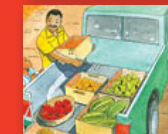
U ṱea ndi zwavhuḁi