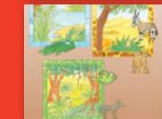
Afha hu dzula nnyi?