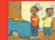
Dzumbamani ndi ni wane