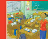
Iḁani u vhona mashika!