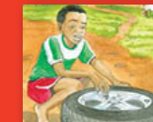
Ndi linga ḽa nnyi?