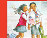
Tshiphiri tsho bvela khagala