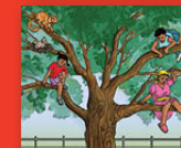
Ri ṭoḁa thuso!