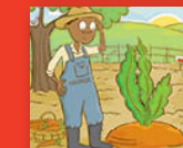
Yo, kherotsi nngafha!