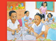
Tshifanyiso tsha zwivhumbeo