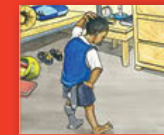
Sogisi ḽo xelaho