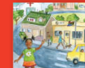
No ṭanganedzwa ḁoroboni ya hashu