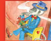
Ee, vho ṭhoho!