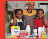
Iḁani ri bake na makhulu