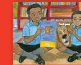
Ndau na mbevha