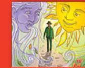
Muṭaṭisano vhubati ha muya na ḁuvha