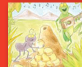
Lusunzi na nzie