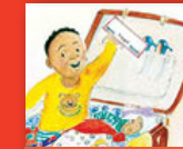
Ro lugela lwendo