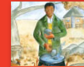
Swobo ya u ḁifhesa ya matombo