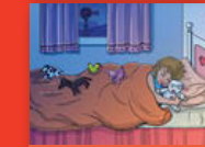
Nḁi vhusiku bulasini