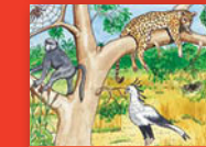
Phukha dza vhezwimi