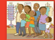
Andani u ya mavhengeleni