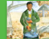
Sopo ya maribye