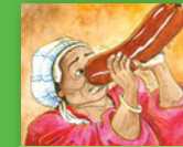
Xitori xa masalamusi