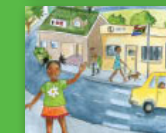
Doroba ra ka hina