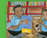
Nghala na kondlo