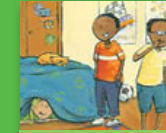
Hi tlanga xitumbelelani