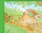
Mpfundla na xibodze