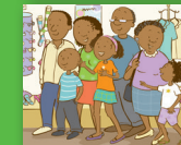
Va ya xava swiambalo