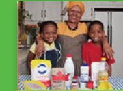
Hi baka na kokwana