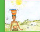
U kwihhi Xiluva?